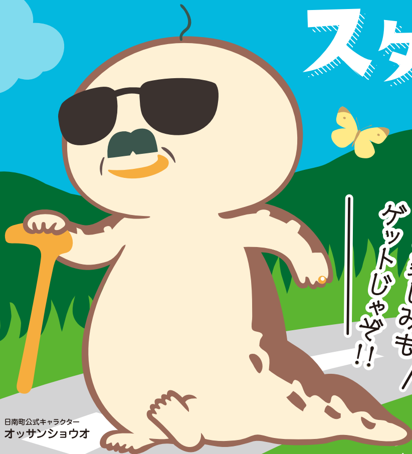
日南町公式キャラクター オッサンショウ